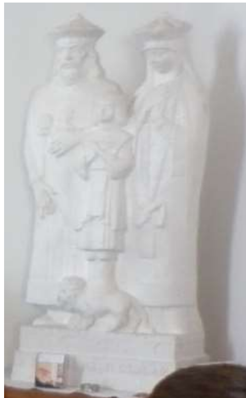
Az első magyar szent család: Szent István király, Boldog Gizella és Szent Imre

http://csaladakademia.schoenstatt.hu/csaladakademia-hirlevelei